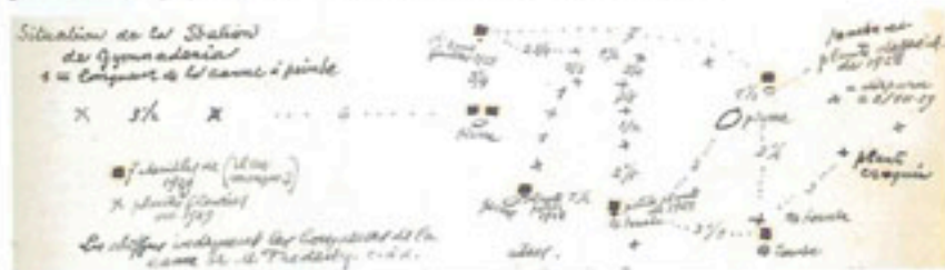
Localisation des Gymnadenia albida le 3 juillet 1929.

Mercredi 3 [juillet 1929]. Planté des fiches en bois à section circulaire à 10 cm. ds la direction du bois à chacune des 16 Gymnadenia + 2 Gymn. près de Périgny. Une des Gymnadenia manque à l'appel.