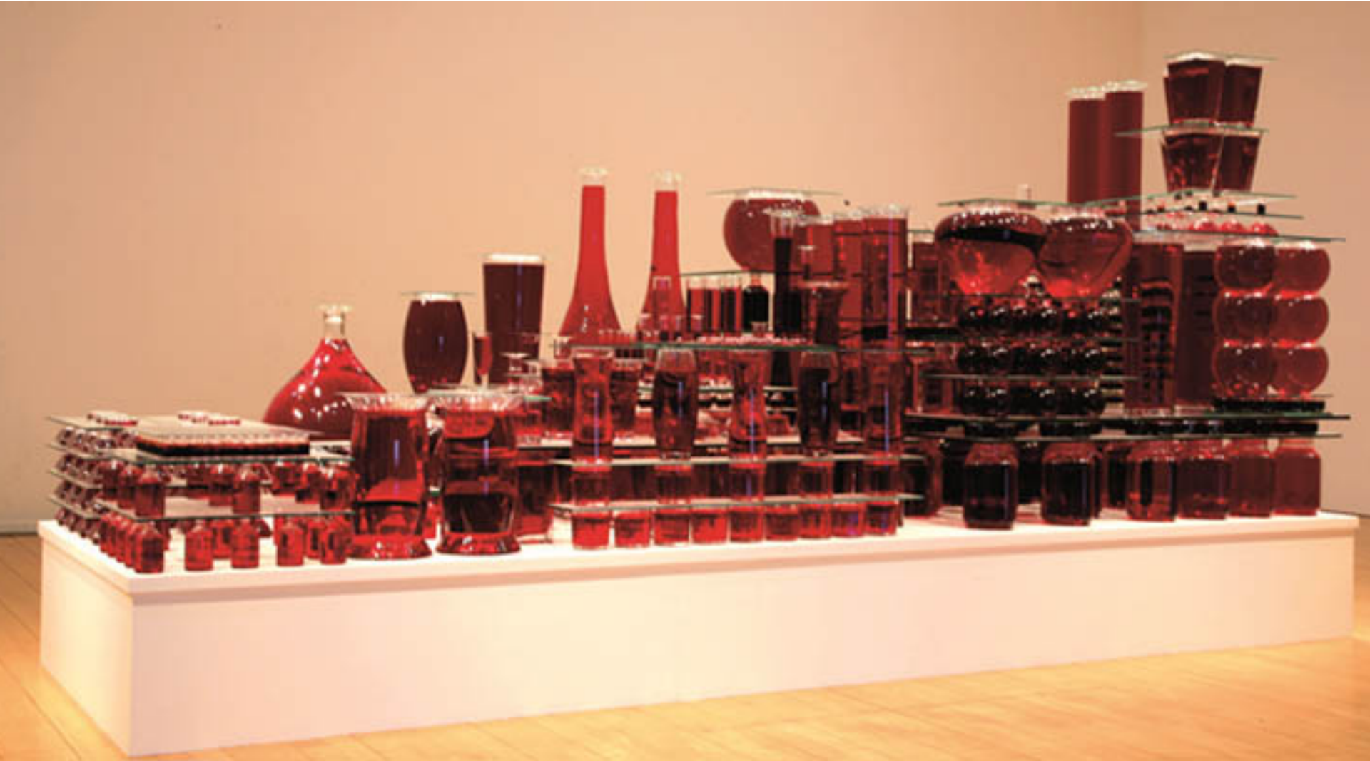
Laurence Dervaux, La quantité de sang pompé par le cœur humain en une heure et vingt-huit minutes, 2003. Réceptacles en verre transparent et liquides colorés, 110 x 340 x 180 cm

Pour certains des artistes exposés, le thème de la médecine et du corps est un véritable fil rouge qui guide leur travail. C'est le cas, par exemple, des œuvres de Laurence Dervaux. Sa création mettant en scène « La quantité de sang pompé par le cœur humain en une heure et vingt-huit minutes » est une des pièces maitresses de l'exposition. De très grande dimension, cette œuvre n'a que rarement été montrée au grand public ! Assemblant sept cent cinquante réceptacles de formes et de tailles variées remplis d'eau rouge, elle déploie la diversité des couleurs du sang et de ses « états », en même temps qu'elle met en exergue de manière fascinante et un brin inquiétante l'importance et la fragilité du contenant. Qu'advient-il en effet de ce liquide vital qui nous constitue, dès lors que la machine qui le fait circuler déraile, ou que l'enveloppe corporelle présente des failles ? Le travail de Laurence Dervaux renvoie aux limites de notre matérialité.