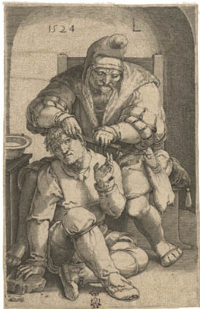
Philippus Galle, Planche d'anatomie-

docteur Tulp de Rembrandt, dont l'exposition propose une copie, en est le plus célèbre exemple. Au XIX e siècle, le fossé entre art et science se creuse et la représentation du corps se fait de plus en plus objective. L'invention de la photographie a rendu obsolètes ces représentations anatomiques. Mais les liens entre art et médecine n'ont jamais cessé.